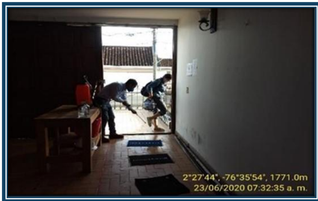
Desinfección de calzado

Antes de ingresar a las instalaciones de la UT4G Popayán es necesario la desinfección de los zapatos y aplicación del gel antibacterial en sus manos y antebrazos .