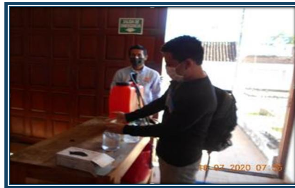
Aplicar gel antibacterial manos