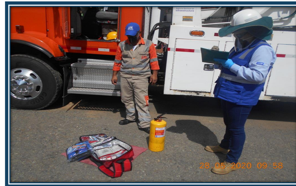
Inspección de los elementos de emergencia de los vehículos en las instalación de CCO Rio Ovejas PR 49+050