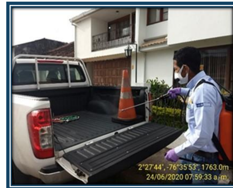
Desinfección y limpieza de vehículos de la Interventoría UT4G