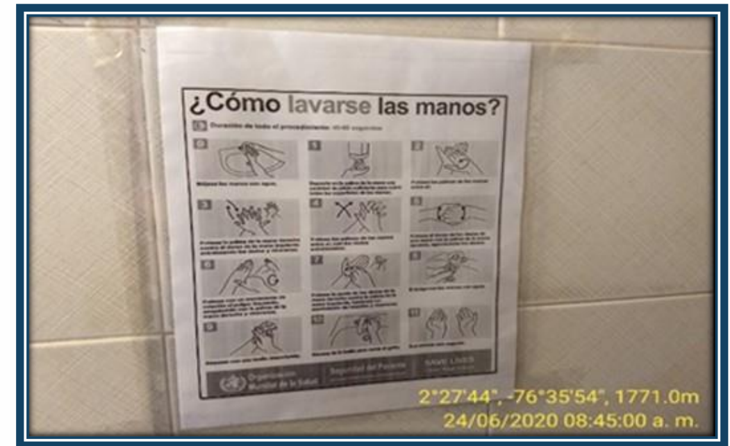
Protocolo para el lavo de las manos en las instalaciones de los lavamanos de los baños..