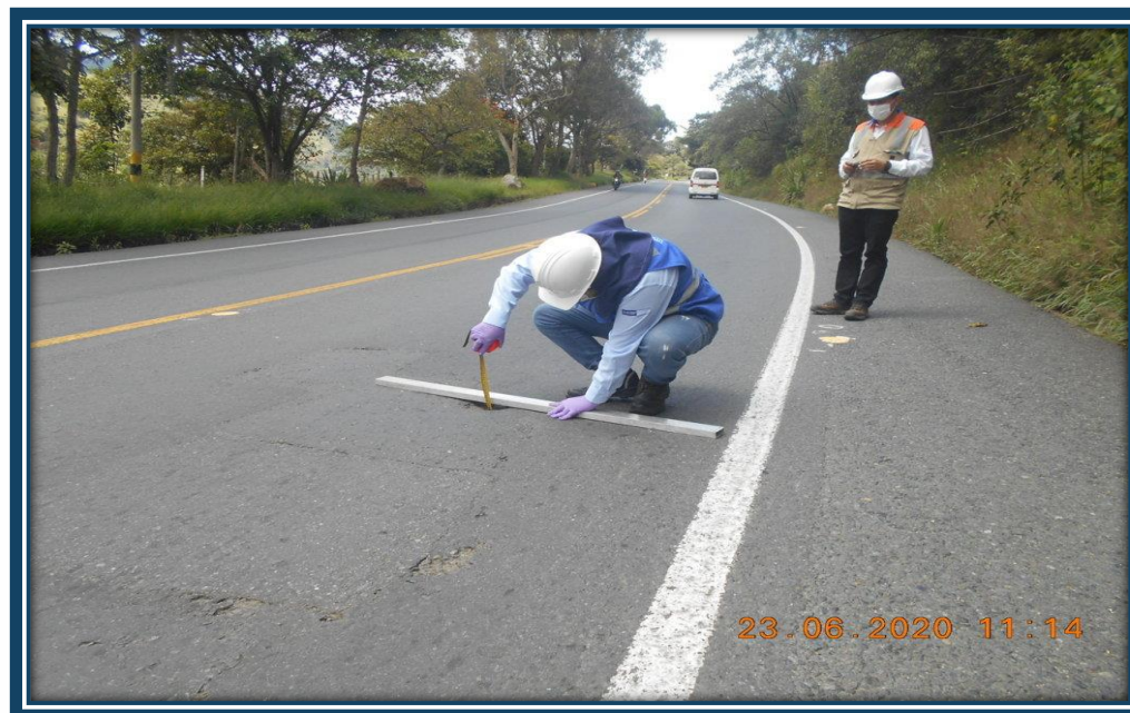
Inspección de indicadores en el corredor Popayán – Santander de Quilichao

Usando siempre los elementos de protección individual y de bioseguridad en las actividades de recorrido de campo e inspecciones de las instalaciones de CCO del Concesionario