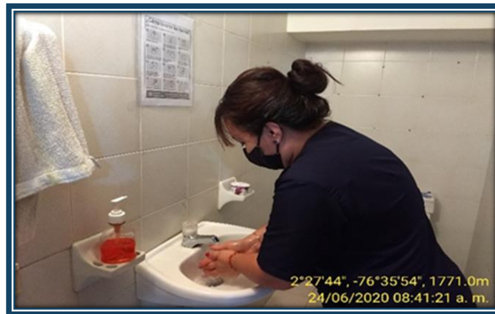
Lavado de manos en las instalación de la oficinas UT4G