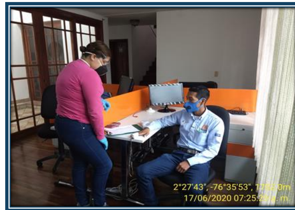
Toma del Pulso – Saturación de Oxígeno.