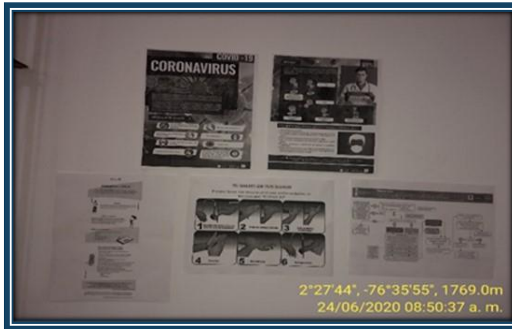
Recomendaciones para prevenir el contagio del COVID -19 en la Recepción de la Interventoría.